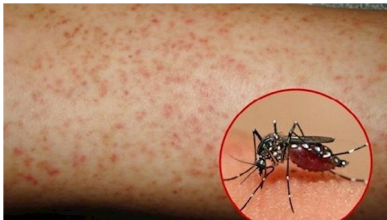
Hình ảnh xuất huyết dưới da

Vì sức khỏe của mỗi gia đình và của cả cộng đồng. Nhà trường kêu gọi tất cả các thầy cô giáo và các em học sinh hãy quan tâm thực hiện tốt các biện pháp phòng chống bệnh sốt xuất huyết với khẩu hiệu: “Không có lăng quăng, không có muỗi vằn, không có sốt xuất huyết”